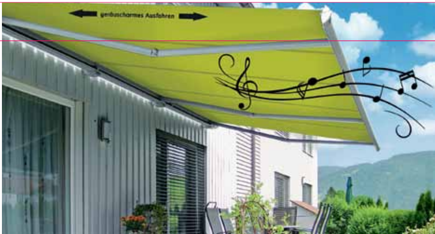
Klang-Markise Die Markilux 6000 Concertronic bringt Musik auf den Balkon, etwa von einem per Bluetooth oder Kabel verbundenen Handy, und das ganz ohne Lautsprecher. Patentierte Technik versetzt dafür das Gehäuse in Schwingungen, die sich auf die Luft übertragen.